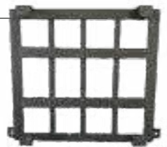
Acabado en líneas 4189/HERRER0223PE

*Incluye Instalación del paquete completo *Incluye póliza contra robo