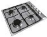
Parrilla TEKA 4 quemadores